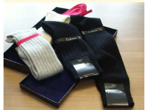
Foto unten: Socken aus Cashmere – ideal für die nasskalte Jahreszeit. Für sportive Damen in grau und pink.